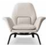
3-4 GILLIAM POLTRONA CM 90X85 H86 POUF CM 67X55 H38