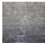
11 DIBBETS RAINBOW "ARCTIC" TAPPETO CM 400X300