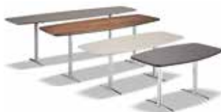
6 WILSON CONSOLLE CM 180X50 H27